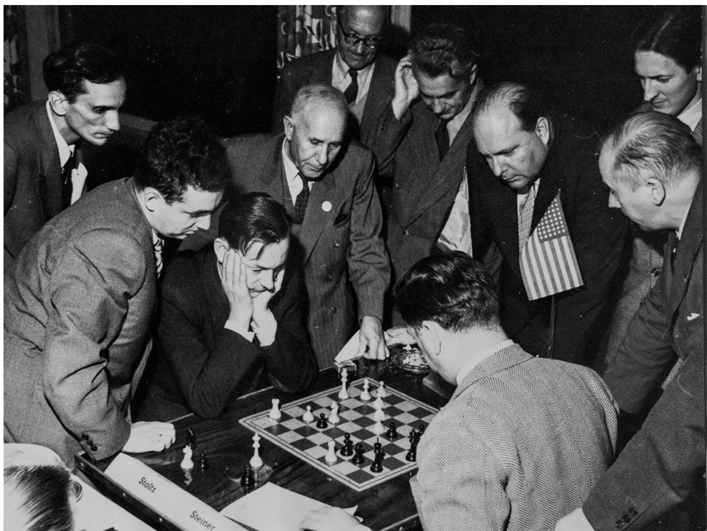
Interzontturneringen i Stockholm/Saltsjöbaden 1952.

”Dagens sensationsparti levererade Stoltz och Steiner /USA/. Svensken offrade först pjäs, sedan dam och vann efter svår ömsesidig tidsnöd och en serie snabbt växlande situationer. Partiet belönades med första skönhetspriset”. /Ståhlberg/