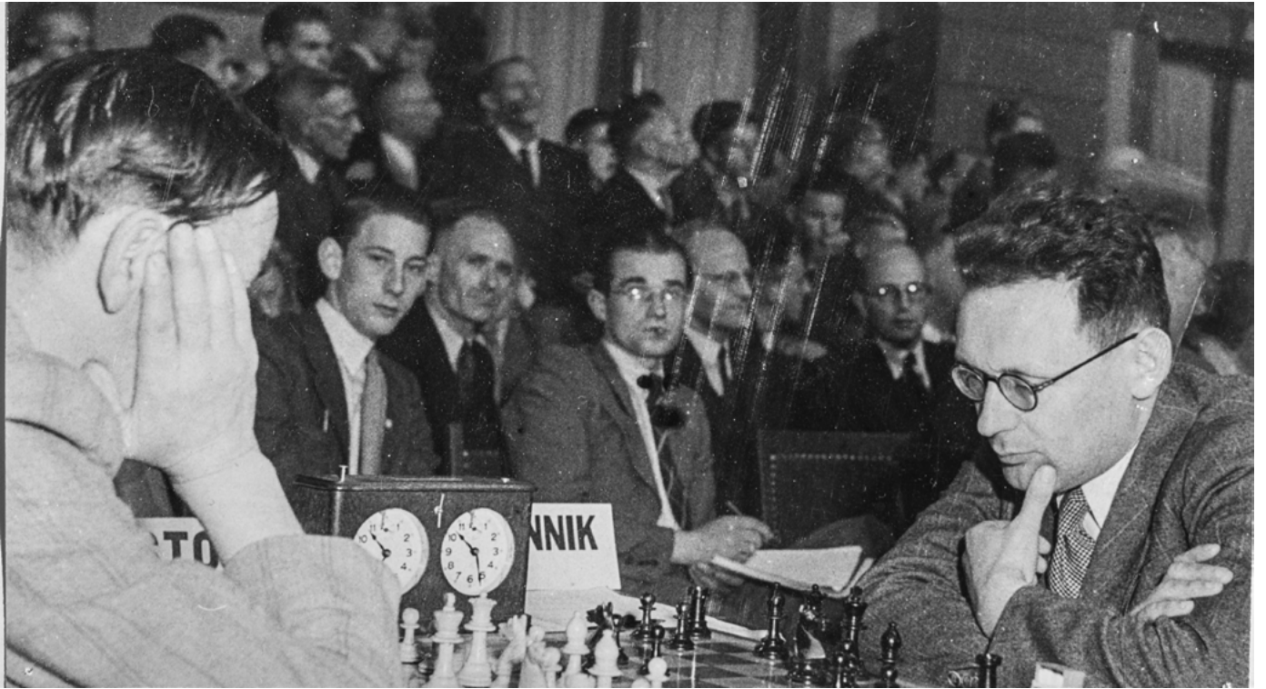
Stoltz mot Botvinnik i Groningen. (Holland 1946)